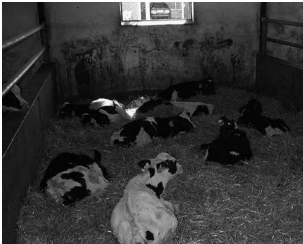
Kalve, der er over 8 uger gamle, skal som udgangspunkt opstaldes i grupper.