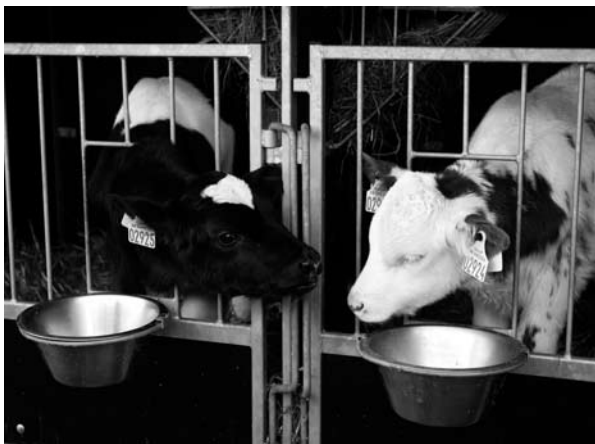
Kalve er meget motiverede for social kontakt, og de skal have mulighed for at se og røre andre kalve.

Op til kalvene er 8 uger gamle, kan de opstaldes enkeltvis eller i grupper. Hvis de opstaldes enkeltvis, skal de dog som tidligere nævnt stadig have mulighed for at kunne se og røre andre kalve, og efter 8 ugers alderen skal de opstaldes i grupper. Under naturlige forhold integreres kalve i flokken ved 1-2 ugers alderen, og fra 2 ugers alderen har de mere social kontakt med andre kalve end med deres mor (hvis diegivning fraegnes). Kalve er meget motiverede for social kontakt, og isolation er en belastning. Kravet om kontakt til andre kalve er derfor begrundet med hensyn til kalvenes sociale og adfærdsmæssige udvikling. Det er uvist, hvilken effekt der vil være af manglende kontakt i blot de første leveuger, da isolationen af kalvene i de undersøgelser, der er foretaget, typisk varer i længere tid. Kalvene er dog på dette tidspunkt også meget følsomme for infektioner, og risikoen for sygdom øges med gruppestørrelsen. De ville derfor være bedre beskyttet mod smitte med diverse sygdomme, hvis