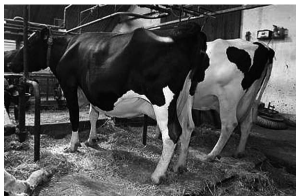
Traditionelt har de fleste køer stået i bindestalde, hvor de står tøjret i en bås døgnet rundt. Stalde af denne type er under afvikling i Danmark.

Traditionelt har de fleste køer stået i bindestalde, hvor de står tøjret i en bås døgnet rundt. Selv om bindestalde er under afvikling, findes der dog stadig en del stalde af denne type i Danmark. Hos køer i bindestalde ses sidst på vinteren og i det tidlige forår en del sygdomme, der kan relateres til opstaldningsformen. Den manglende mulighed for bevægelse i vinterperioden gør dyrenes muskler, led og lemmer svage, og sammenlignet med køer i løsdriftssystemer ses flere tilfælde af visse produktionssygdomme. Brugen af bindestald kan kombineres med adgang til udendørs arealer, hvilket giver køerne mulighed for motion og afgræsning. Det forudsætter dog, at arealerne er velindrettede. Undersøgelser har vist, at bundne køer som fik motion i løbegård dagligt i vinterperioden var mere adrætte end køer, der var permanent opbundne,