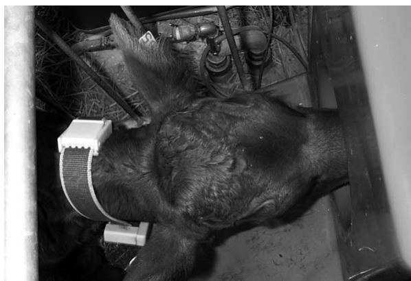
Ved brug af en mælkeautomat forsynes kalven med et halsbånd med chipmærkning (transponder), så automaten kan tildele individuelt bestemte mængder mælk.