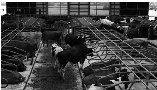
Gennem de sidste 15 år er antallet af malkekvægsbesætninger faldet, mens størrelsen på besætningerne er steget – ofte til over 100 køer.

Den danske kvægproduktion har undergået en markant strukturændring gennem de sidste 30 år. Fra 1975 til 2003 er det samlede antal dyr reduceret med 47% til ca. 1,6 mio. stykker kvæg. Hertil kommer, at antallet af besætninger med malkekvæg gennem de sidste 15 år er faldet med 70%, og den gennemsnitlige størrelse på malkekvægsbesætninger er i samme periode tredoblet til omkring 95 køer i 2005. Især andelen af besætninger med over 100 køer er steget – fra 2,5% i 1991 til 32% i 2004. Og udviklingen i retning af stadig færre men større besætninger ser ud til at fortsætte.