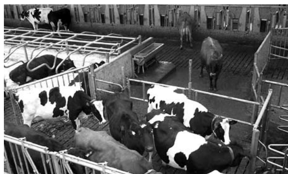
For at sikre at koen kommer hen til malkerobotten, styres trafikken i stalden med envejslåger, så koen skal gennem robotten for at komme fra sengebåseafdelingen til foderbordet.

Erfaringer viser, at frie bevægelsesmuligheder for køerne i stalden kan medføre en stor variation i antallet af daglige malkninger. Problemet kan afhjælpes ved at styre trafikken i stalden med envejslåger, så koen skal gennem robotten for at komme fra sengebåseafdelingen til foderbordet. Ulempen ved denne løsning er dog, at det samtidig kan medføre en reduktion i antallet af ædeperioder, og for lavt rangerende køer kan det betyde lang tids ophold på opsamlingspladsen foran malkerobotten inden malkning. Dette vil sandsynligvis reducere både produktionen og dyrenes velfærd.