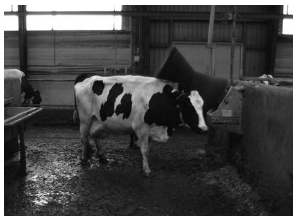
En kobørste til hudpleje er en mulig form for miljøberigelse i kvægstalde.

Jan Brøgger Rasmussen, Landscentret Dansk Kvæg