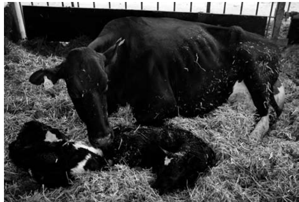
Problemer omkring kælvningen opstår eller forværres, hvis koens ernæringsmæssige behov ikke tilgodeses.

I forbindelse med og efter kælvning kan der ses problemer med selve kælvningen samt sygdomme og stress hos koen. Problemerne opstår eller forværres bl.a. fordi, koens ernæringsmæssige behov ikke tilgodeses, og der udvikles stofskifteproblemer, eller koen ikke kommer i kælvningsboks, eller den returneres for hurtigt til flokken efter kælvningen. Det Dyreetiske Råd finder, at årsagerne til problemerne er af en sådan karakter, at de bør kunne forbygges eller helt undgås. Rådet finder derfor, at det er nødvendigt med tiltag, der sikrer, at koens behov omkring kælvning bliver tilgodeset.