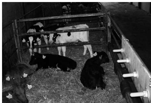
Det er nødvendigt at dække kalves pattebehov, fx ved at give kalvene adgang til en narresut.

nutter, men kalvens motivation for at patte aftager først efter 10-15 minutter. Hvis behovet for at patte ikke tilgodeses ved mælketildelingsmetoden, kan der opstå unormal patteadfærd, fx patter kalvene på hinanden eller inventaret lige efter, at de har drukket mælken. Den unormale patteadfærd rettet mod andre kalve øger risikoen for at overføre smitte med fx diarré, og adfærden kan medføre såkaldt ”urindriking” på tyrekalve og kan disponere for udvikling af patteadfærd hos de voksne dyr (”mælkeran”). For at hindre kalve i at patte på hinanden er det derfor nødvendigt at dække ikke bare deres behov for mælk, men også deres pattebehov. Det kan gøres ved enten at tildele mælken via et system med en kunstig patte, eller ved at give kalvene adgang til en narresut. Langt de fleste kalve, der er opstaldet enkeltvis, lærer at bruge narresutten af sig selv, men nogle kalve skal have hjælp i starten til at lære at bruge den. Ved gruppeopstaldning skal der være en narresut pr. kalv for at hindre, at kalvene sutter på hinanden. Brugen af narresutter vanskeliggøres dog af, at disse er rene og tørre og derfor fremstår mindre attraktive end de andre kalve, der har mælk om munden. Narresutter bør derfor placeres lige over mælkekarret, men den sikreste måde at reducere den unormale patteadfærd på er ved at tildele mælken via en sut.