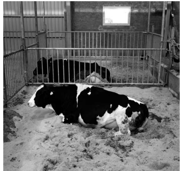
En kælvningsboks er en separat boks, hvor et dyr, der skal kælte, isoleres fra de øvrige dyr i stalden. Boksens bund består typisk af et blødt lejemateriale, fx sand.

Hvis flere køer går sammen ved kælvning, kan den enkelte ko blive forstyrret ved kælvningen, hvilket kan forhale forløbet og medføre øget risiko for dødfødte eller svage kalve. Efterfølgende er der endvidere risiko for, at kalven patter de forkerte køer og dermed ikke får tilstrækkelig råmælk. Erfaringsmæssigt ses der færrest problemer med kælvning, hvis køerne kælver på græs eller i dybstrøelse, evt. i en dybstrøelsesboks med tilstrækkelig plads, mulighed for at isolere sig og god hygiejne.