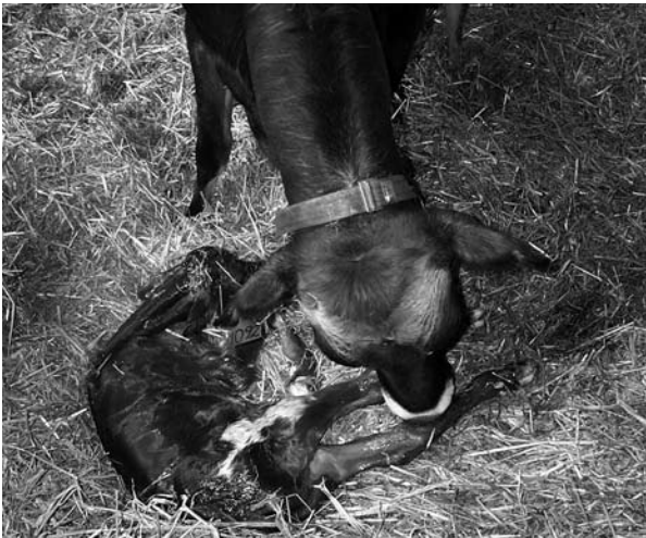
Ro og plads giver koen mulighed for at udføre normal adfærd omkring kælvningen, fx slikning af kalven.

foregå her. Kælvningsforholdene er i et vist omfang lig naturens og kan give mulighed for, at dyrene kan isolere sig, som de gør i naturen. Der er også ro og plads til, at den øvrige normale adfærd omkring kælvning kan foregå, fx slikning af kalven. Til gengæld kan der være problemer med overvågning, idet dyrene ofte ikke bliver tilset så hyppigt som i stalden. En løsning kan være at flytte dyr hjem, der ser ud til at skulle kælte snart. Det rigtige tidspunkt kan imidlertid være svært at fastslå, fx fordi tegn på den forestående kælvning kan vise sig meget sent, eller dyrene kælver før forventet.